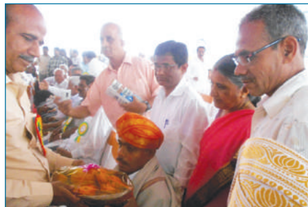
ರಾಜ್ಯ ಸರ್ಕಾರ 60ನೇ ಸಹಕಾರಿ ಸಪ್ತಾಹ ಸಮಾರಂಭದಲ್ಲಿ ಉದಯ ಸೌಹಾರ್ದ ಪತ್ತಿನ ಸಹಕಾರಿಗೆ ಅತ್ಯುತ್ತಮ ಸಹಕಾರಿ ಎಂದು ಪ್ರಶಸ್ತಿ ನೀಡಿ ಮರಸ್ತರಿಸಿದೆ.